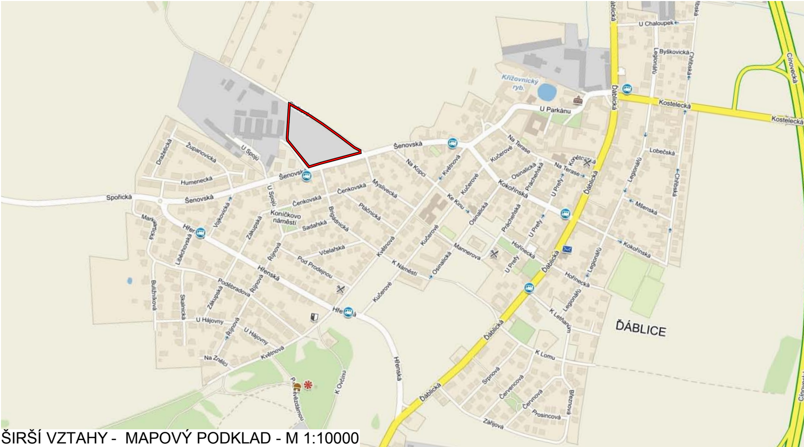
ŠIRŠÍ VZTAHY - MAPOVÝ PODKLAD - M 1:10000