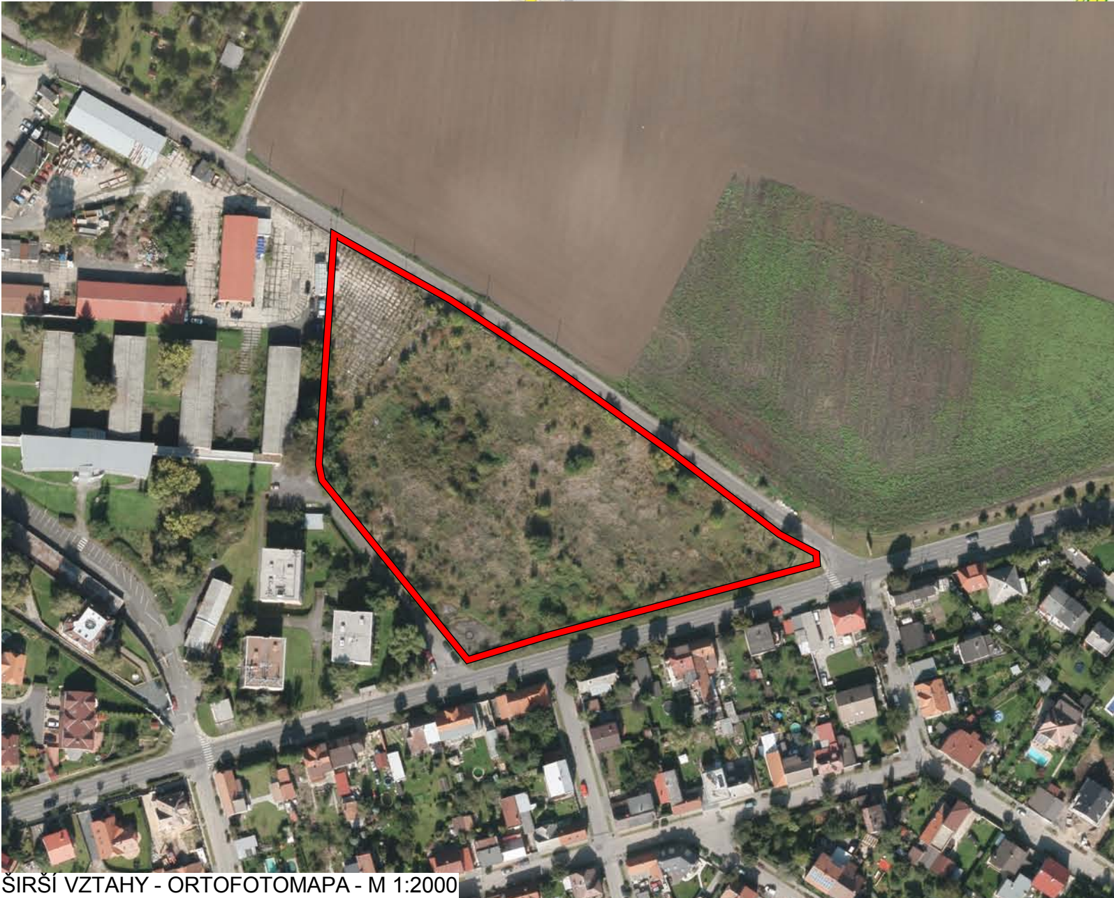
ŠIRŠÍ VZTAHY - ORTOFOTOMAPA - M 1:2000